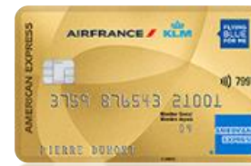
Amex AF KLM GOLD