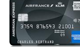
Amex AF KLM Platinum