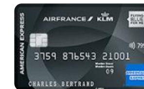
Amex AF KLM Platinum