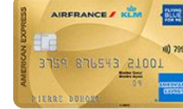
Amex AF KLM GOLD