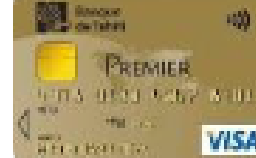
VISA 1 er