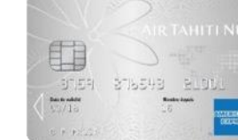
ATN American Express Silver