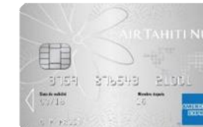
ATN American Express Silver